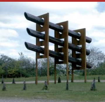
7. Tycho Brahe