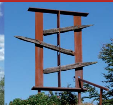
9. L'homme de Tørskind