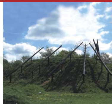
6. Les Cheveux de Saturne

Eest constitué de trois poutrelles de fer formant un triangle. Le triangle symbolise le spirituel tandis que la forme circulaire de la zone symbolise l'infini, le ciel et le cosmos.